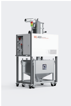
▲ 物料机 BLT-WL400