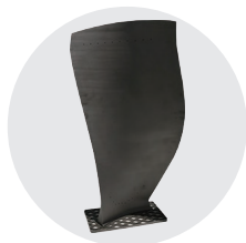
航空发动机风扇叶片