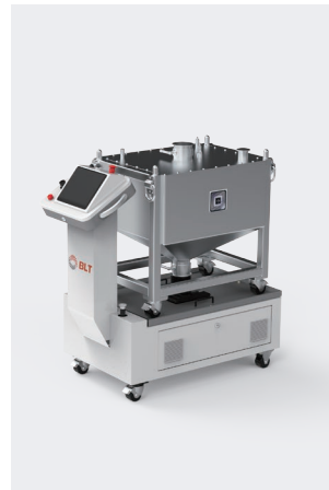
▲ 供粉机 BLT-GF300