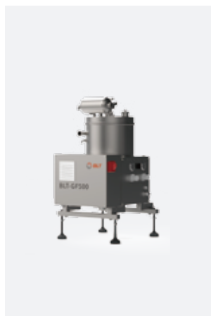
▲ 供粉机 BLT-GF500