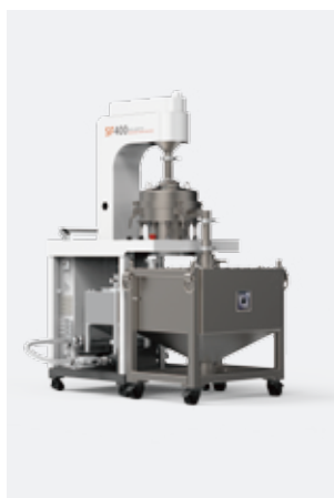
▲ 筛粉机 BLT-SF400