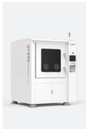
▲ 清粉机 BLT-QF600