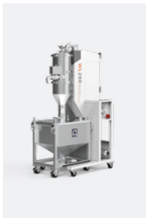
▲ 物料机 BLT-WL200