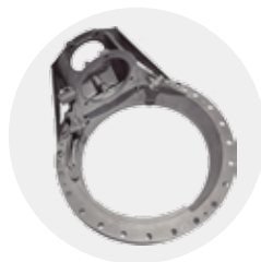
中央齿轮传动壳体